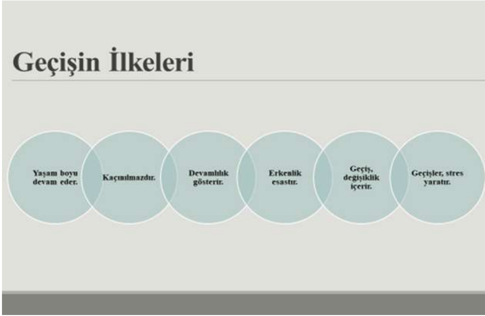
Şekil 1. Geçiş İlkeleri