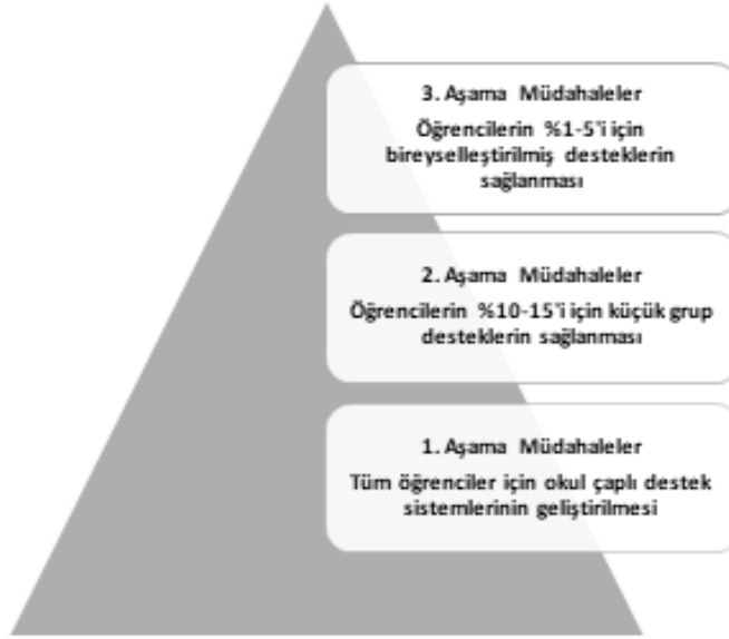
Figür 1. Olumlu Davranışsal Müdahaleler ve Destekler Uygulama Aşamaları

ODD, birbiriyle bağlantılı beş bileşenin etkili bir şekilde çalışmasını gerektirmektedir. Bu bileşenler; (a) sistem, (b) veri, (c) uygulama, (ç) çıktılar ve (d) eşitliktir. Her okulun işleyiş prensiplerinin olduğu bir sistemi mevcuttur. Bu sistem içerisinde bir çalışma ekibinin oluşturulması, gerekli eğitimlerin ve koçluk uygulamalarının sunulması ODD'nin etkili bir şekilde çalışmasını sağlamaktadır. Okullarda öğrenciler ile ilgili pek çok veri toplanmaktadır. Bu veriler arasında onları uyarma, kınama, okuldan veya sınıftan uzaklaştırma gibi disiplin verileri yer almaktadır. ODD'nin üç aşamasında da ekipler öğrenciler ile ilgili verileri belirli aralıklarla toplama, analiz etme ve değerlendirme gibi çalışmalar yapmaktadır. ODD'deki uygulamalar araştırmalar tarafından desteklenmiş yöntem ve stratejileri içermektedir. ODD'nin en önemli amacı disiplin, olumlu okul iklimi oluşturma, öğrencilerin sosyal ve duygusal gelişimini destekleme gibi çıktıları öğrenciler, eğitimciler ve aileler ile iyileştirmektir. Son on yılda, ODD'yi kültüre uyumlu hale getiren çok çeşitli ve değişken, okulların ortamlarını ve paydaşlarının beklenti ve ihtiyaçlarını dikkate alarak tüm öğrenci gruplarına (dil ve kültürel farklılıkları olan öğrenciler, özel gereksinimi olan öğrenciler) başarı için eşit fırsatlar sunmayı hedefleyen yeni modeller geliştirilmiştir (Bal, 2011; 2018; Bal vd., 2018).